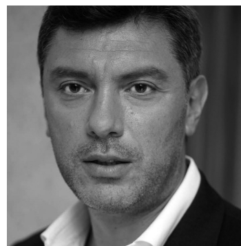
Борис НЕМЦОВ, член Бюро движения «Солидарность»

Задача, которую мы перед собой ставим – непростая. В условиях тотальной политической цензуры объяснить людям истинные итоги и цели правления Путина непросто. Цель – раскрыть глаза гражданам на воровскую вертикаль и её вдохновителя и архитектора В. Путина. Только после того, как гражданам осознают, кто ими управляет более 10 лет, можно добиться политических и социально-экономических перемен в стране.