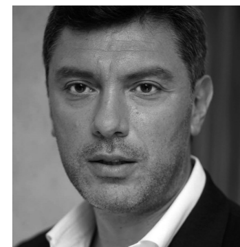
Борис НЕМЦОВ, член Бюро движения «Солидарность»

Задача, которую мы перед собой ставим – непростая. В условиях тотальной политической цензуры объяснить людям истинные итоги и цели правления Путина непросто. Цель – раскрыть глаза гражданам на воровскую вертикаль и её вдохновителя и архитектора В. Путина. Только после того, как гражданам осознают, кто ими управляет более 10 лет, можно добиться политических и социально-экономических перемен в стране.